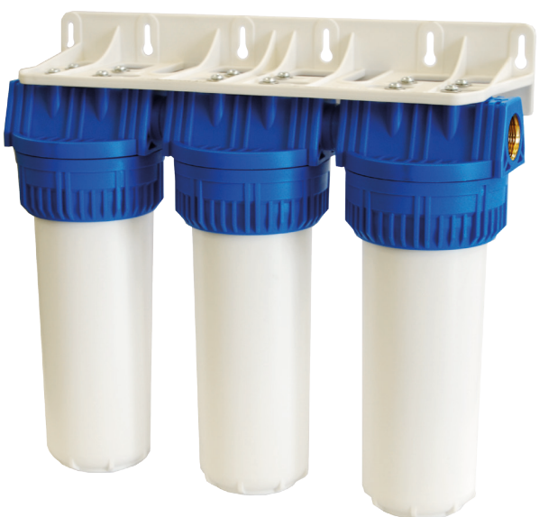
Contenitore per cartucce serie FP3 Triplex testa inserto ottone vaso opaco bianco FP3 Triplex filter cartridge housings with brass inserts and opaque white sump