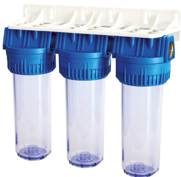
Contenitore per cartucce serie FP3 Triplex testa inserto ottone vaso SAN trasparente FP3 Triplex filter cartridge housing with brass inserts and transparent SAN sump