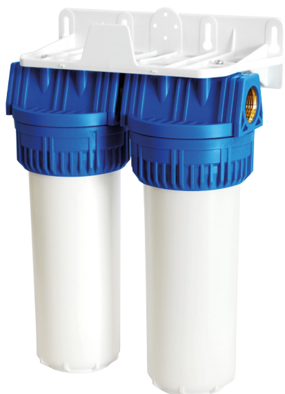
Contenitore per cartucce serie FP3 Duplex testa inserto ottone vaso opaco bianco FP3 Duplex filter cartridge housings with brass inserts and opaque white sump