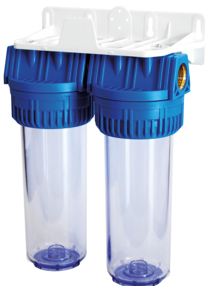
Contenitore per cartucce serie FP3 Duplex testa inserto ottone vaso SAN trasparente FP3 Duplex filter cartridge housing with brass inserts and transparent SAN sump